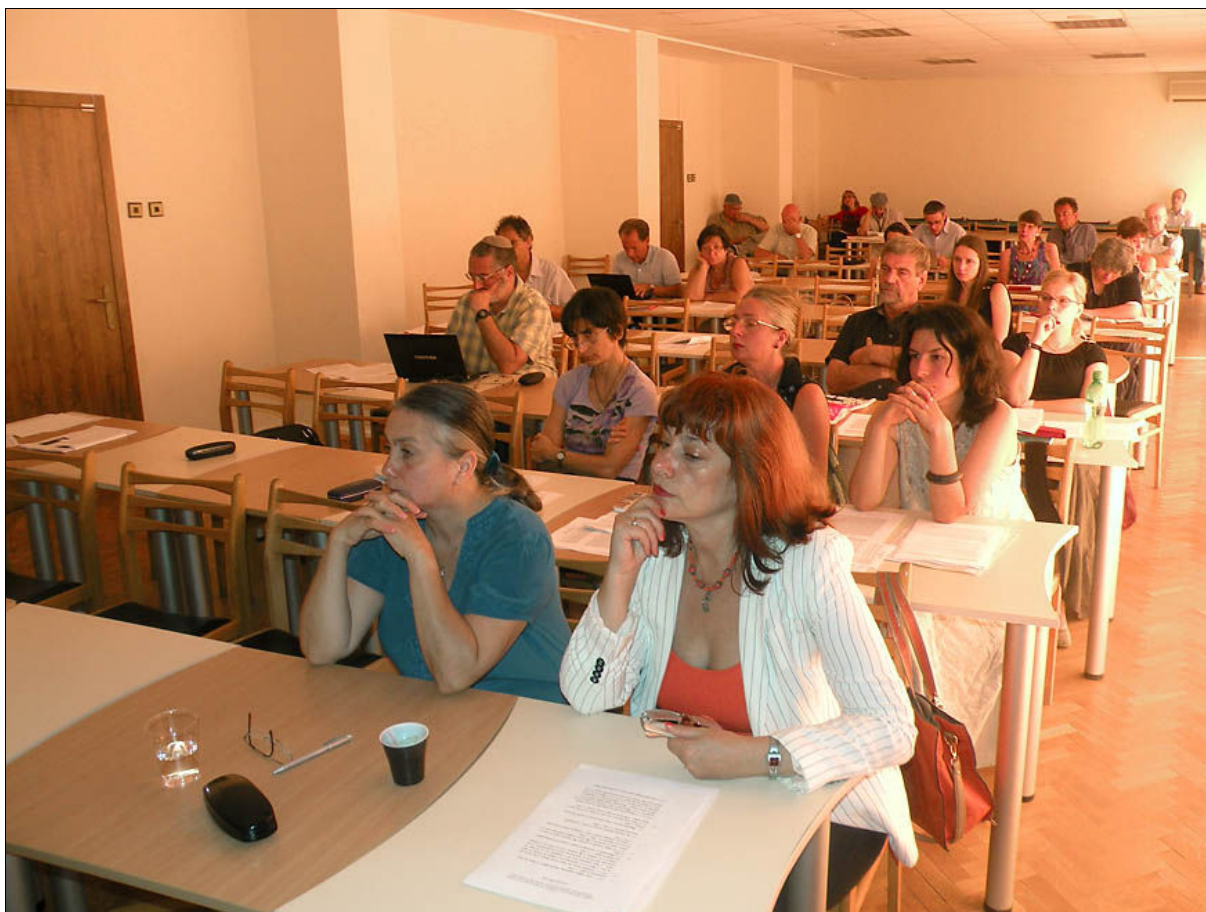
Момент от конференцията